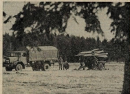
IN DER LETZTEN WOCHE fand beim Plzrak-Bataillon 32 eine ueberschaende NATO-Uebersuehung statt. Das aus Spezialisten mehrerer NATO-Staaten bestehende Team nahm die Soldaten und die Raketenruecken des Bataillons mehrere Tage lang sorgfaellig unter die Lupe. Das Ergebnis war verstaerkend: Wie bereits 1974 erreichte das Bataillon die Gesamtnote 1. Das Btl 32 ist in der Geschichte der NATO-Plzrak-Verbände nun auch ein ausgewiesenes Ergebnis dar.